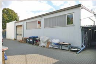
Bau einer neuen Produktions- und Lagerhalle