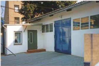
Neue Lagerhalle und Bürogebäude